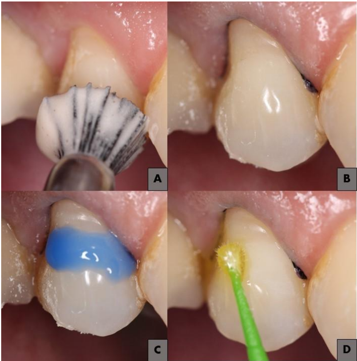
Figura 2: Aplicação do sistema adesivo. (A) profilaxia com pasta de pedra pomes e água; (B) inserção do fio retrator; (C) condicionamento ácido seletivo; (D) aplicação do adesivo.