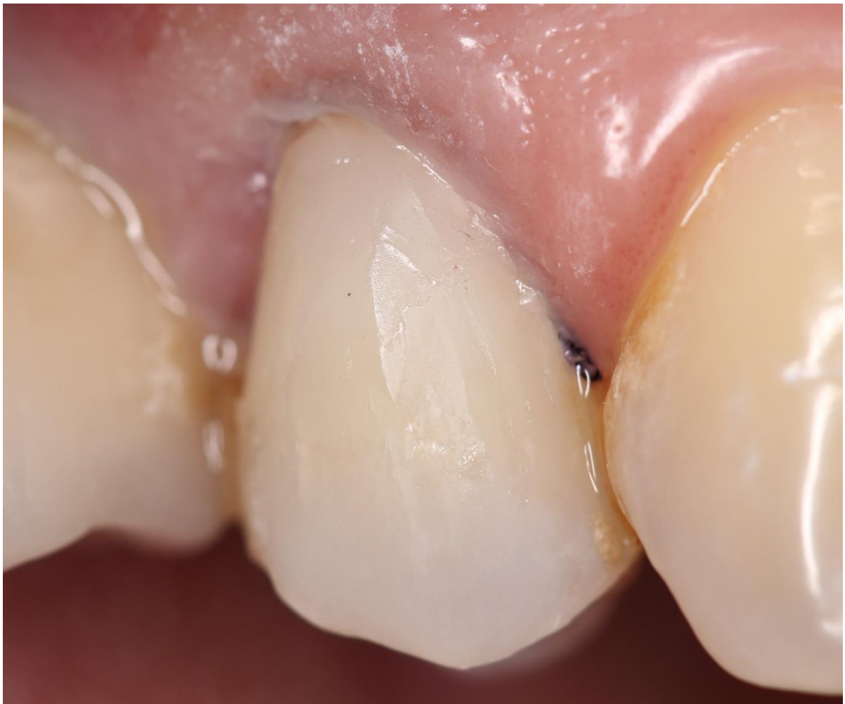
Figura 4: Aspecto clínico final imediato.

O aspecto clínico final pode ser consultado na Figura 04.