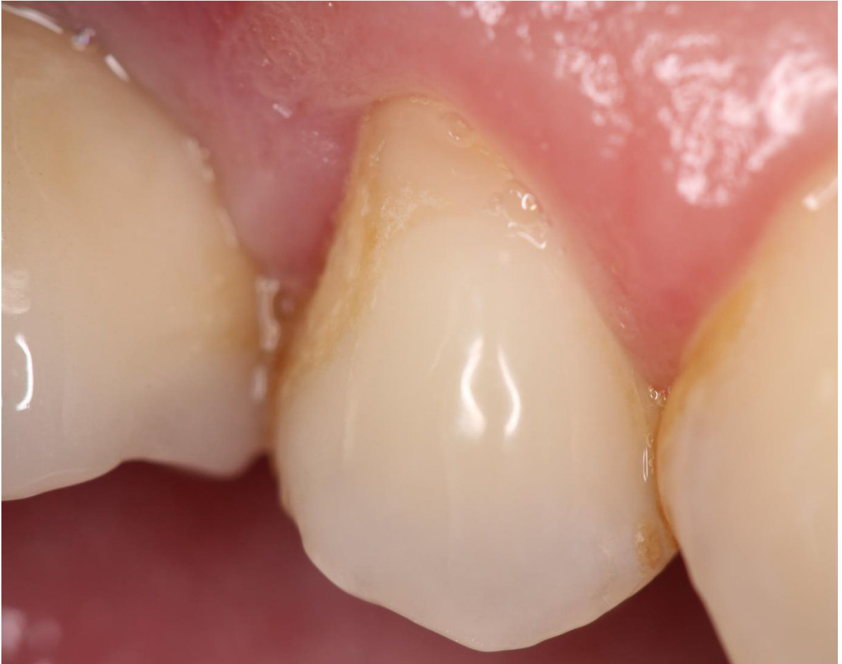
Figura 1: Aspecto clínico inicial