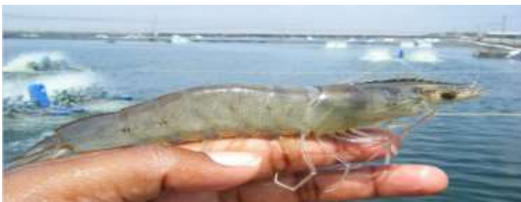
Figura 01: Ilustração da espécie de camarão marinho Litopenaeus vannamei . Fonte: http://www.zealaqua.com/Vannamei-Shrimp.aspx