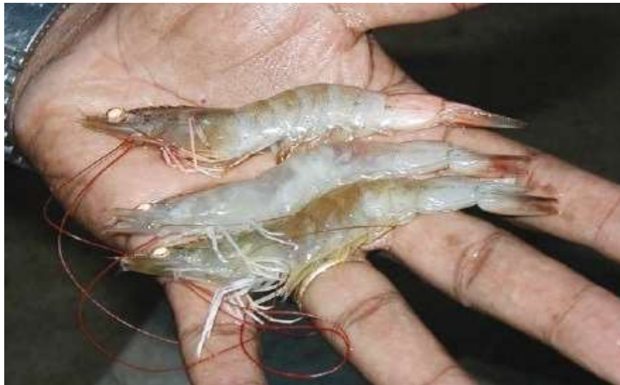
Figura 04: Ilustração de um camarão marinho contaminado com mionecrose infecciosa, panorama da aquicultura fonte atual.

A principal transmissão é pelo canibalismo. Existem suspeitas de transmissão pela água, mas não há comprovação científica. A manifestação clínica é a letargia após o estresse, zonas necróticas brancas no abdome distal e repleção intestinal (CHARRO, 2007).