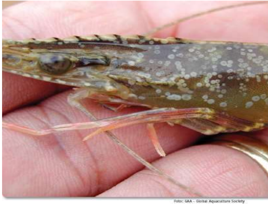
Figura 03: Ilustração de um camarão marinho contaminado com a Mancha branca. global aquaculture society

Mudanças bruscas de salinidades e temperatura de água abaixo de 18°C ou acima de 30°C são os principais fatores que podem trazer. Manifestações clínicas: letargia, coloração de rósea a marrom, queda do consumo de alimento e alteração de comportamento de se aproximar nas margens e na superfície da água. (CHARRO, 2007).