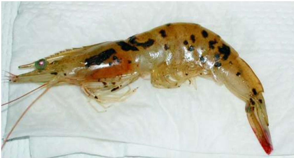
Figura 02: Ilustração de um camarão marinho contaminado com a síndrome de taura. AQUAVIETNAM. Taura Syndrome – TSV: American Aqua Viet Nam CO., Ltda. 2016.

O alvo principal do vírus causador da síndrome de taura é tecido localizado logo abaixo da carapaça e os sobreviventes costumam ter também manchas escuras e erosivas na carapaça (JOHNSON, 1995).