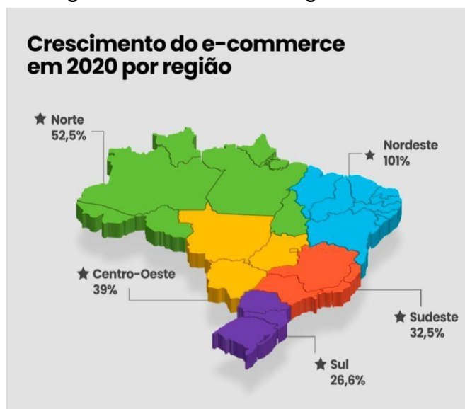
Figura 2 - Crescimento regional

A figura 2 faz representação à análise de que o nordeste, seguido da região Norte foram as regiões que mais obtiveram crescimento no e-commerce do país, com 101% e 52,5% respectivamente. Porém, a região sudeste com apenas 32,5% ainda conseguiu se manter no topo quando o assunto foi faturamento anual de vendas, chegando a 57% de crescimento em relação ao ano anterior, seguido pela região sul com 52%, segundo o E-commerce Brasil.