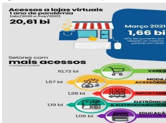
Figura 3 - Crescimento por setores