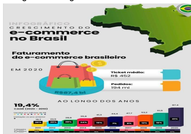
Figura 1- Infográfico de crescimento

A figura 1 faz representação à análise de que o comércio eletrônico brasileiro bateu recordes de vendas no primeiro semestre de 2021. Marcelo Osanai, chefe de e-commerce da Ebit | Nielsen, disse: "Depois de experimentar um rápido crescimento no ano passado, o e-commerce agora está passando por um período de integração". "Os consumidores se adaptaram à conveniência do e-commerce, muitas vezes compram e procuram produtos em diferentes categorias", acrescentou. Devido aos serviços prestados pelas lojas e à adaptação das pessoas ao ambiente online, o e-commerce sempre se manteve em alto nível. Os novos consumidores do e-commerce brasileiro têm apetite maior do que aqueles que já estão acostumados com as compras online.