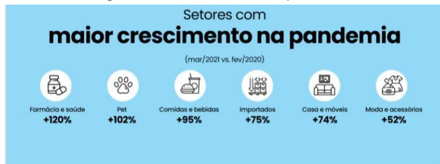
Figura 4 - Crescimento na pandemia

Os setores que mais cresceram durante a pandemia foram os de Farmácia e Saúde (120%), tema com relação intrínseca ao momento pandêmico, de pets (102%) e Comidas e Bebidas (95%), panorama bem diferente do observado no ano anterior, em que os maiores crescimentos estavam relacionados á pets (144%), Alimentos e bebidas (82%) e joias e relógios (49%).