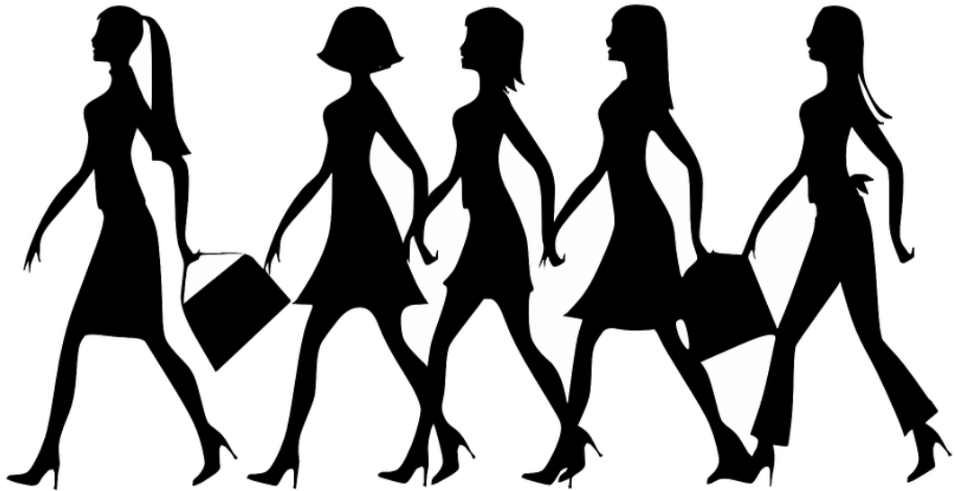
Imagem 2- Desafios do Empreendedorismo feminino