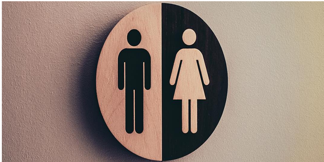
Imagem 3- Ministério do trabalho / Igualdade de Gênero

Dessa forma cabe não apenas a sociedade, mas as instituições criarem condições para o surgimento de organizações que possibilitem às mulheres a ter sua liberdade e igualdade na sociedade para empreender.