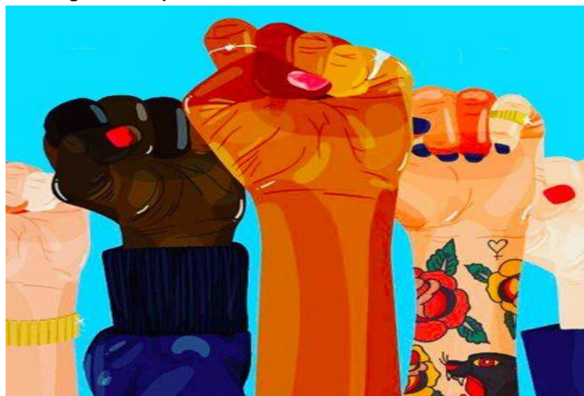
Imagem 1- Empreendedorismo e a cultura “We Can Do It!”

A importância das mulheres como empreendedoras para a sociedade gira em torno da sua contribuição econômica, pois gera emprego para si e para outros, na importância de seu comportamento em administrar a dupla jornada como exemplo social e ainda o aumento da autonomia feminina, antigamente julgado improvável e desnecessário.