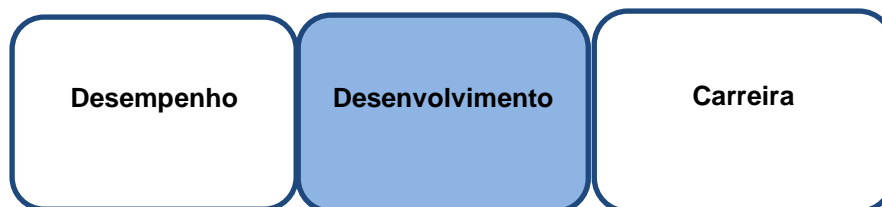
Figura 2: O ponto ideal do coaching